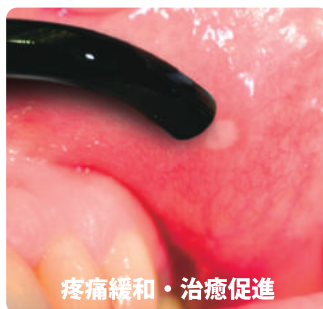
疼痛緩和・治療促進

従来のソフトレーザーだけでなく、技術革新でエンド・ペリオの熱殺菌、光殺菌、外科処置など、一般臨床に幅広く活用可能になった小型ダイオードレーザー。欧米ではレーザーの中心的な装置として普及しています。