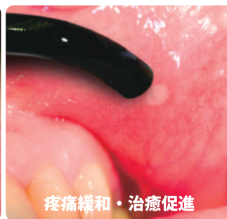
疼痛緩和・治療促進

従来のソフトレーザーだけでなく、技術革新でエンド・ペリオの熱殺菌、光殺菌、外科処置など、一般臨床に幅広く活用可能になった小型ダイオードレーザー。欧米ではレーザーの中心的な装置として普及しています。